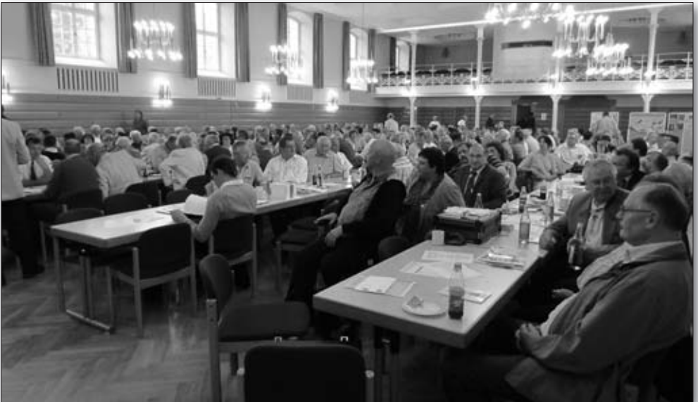
Ein voller Saal von aufmerksamen Zuhörern.

Die Veranstaltung selbst, wurde von den Besuchern ob ihrer kurzen Wege und den niedrigen Preisen sehr gelobt und als gelungen bezeichnet. „Wir kommen wieder“ war der einhellige Tenor.