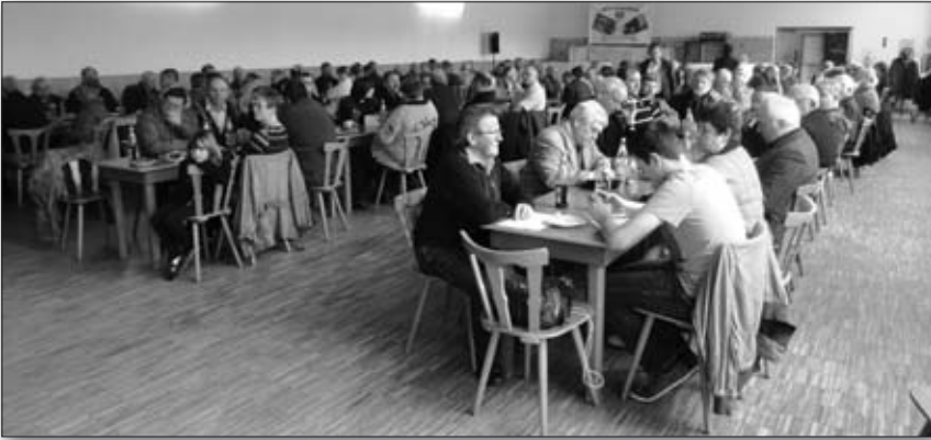
... ein voller Saal