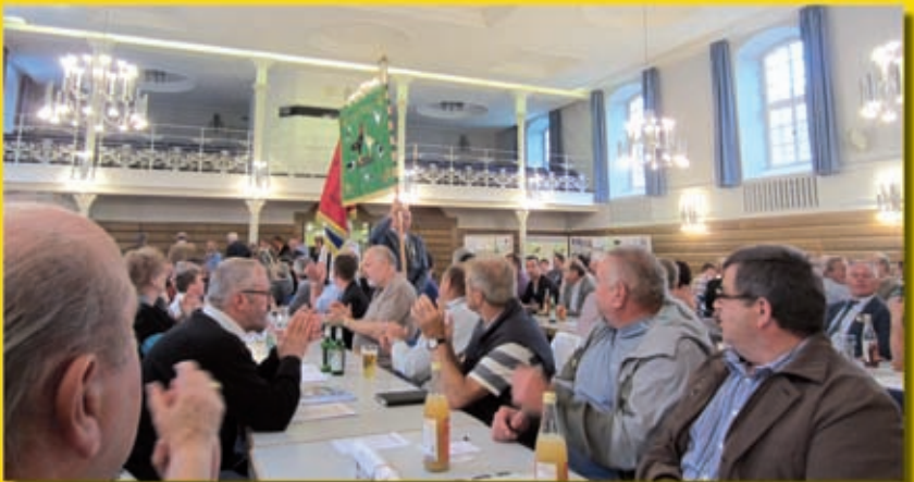
Der Einzug der Fahnenabordnungen