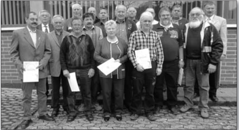
Die neuen Träger der BDRG-Nadel in Gold